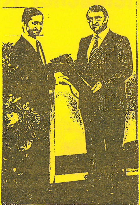
Schlüsselübergabe bei der Einweihung des neuen Kigagebäudes am 02.10.1977