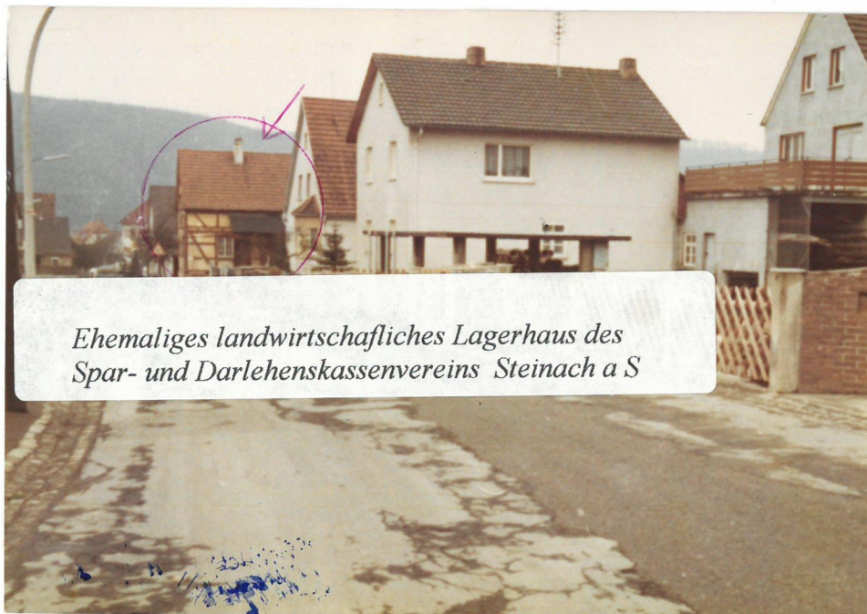
Ehemaliges landwirtschaftliches Lagerhaus des Spar- und Darlehenskassenvereins Steinach a S